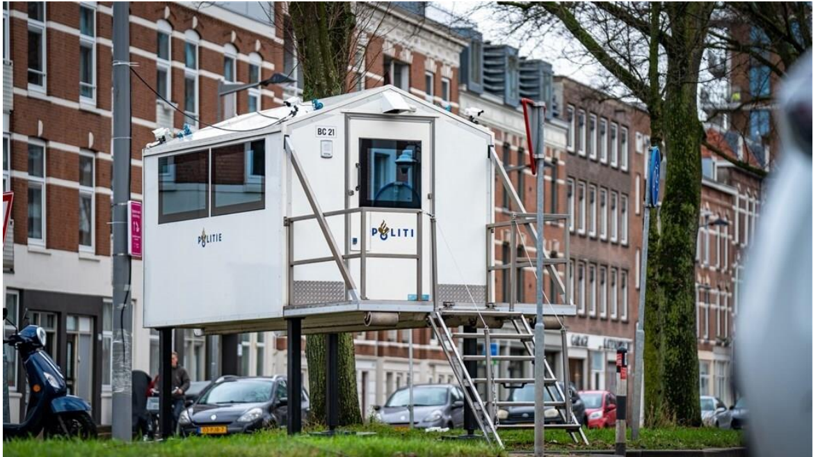
De politiepost bij Hugo de Jonge voor de deur.