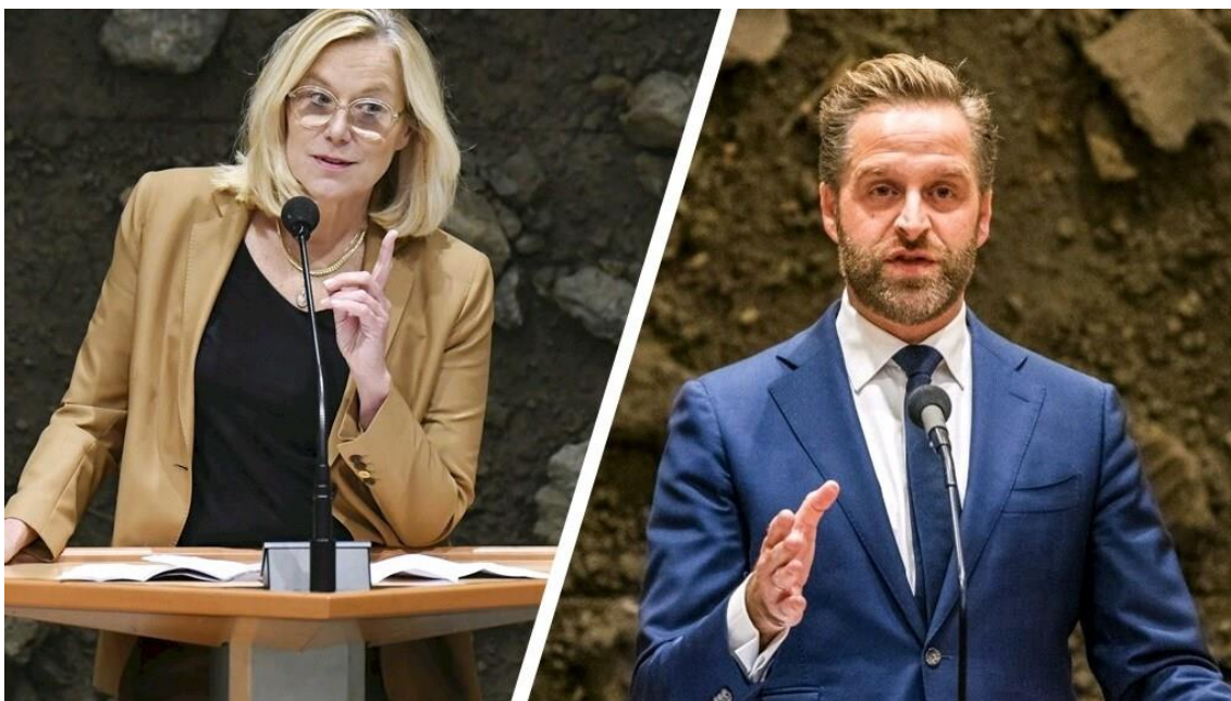
Kaag en De Jonge .